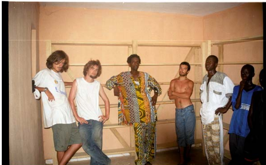
Les compagnons devant leur œuvre...